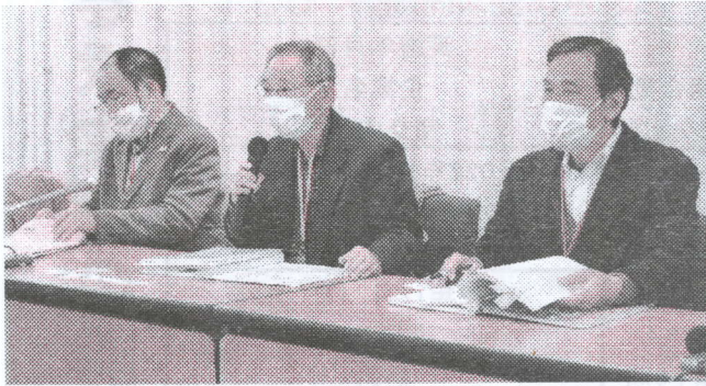
1月26日(木)厚労省記者会会見場での記者会見

電機・情報ユニオンは1月26日(木)、厚生労働省記者会会見場で、アップルジャパン合同会社(以下、アップルジャパン)と第1回団体交渉を2月2日に行うことを記者会見しました。記者会見には、NHKの放映用のカメラ収録が行われるなか、朝日新聞、しんぶん赤旗などの約10社が取材に参加しました。