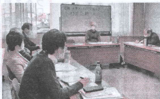
11月28日(日) 茨城支部第9回定期大会

討論では、在宅勤務・テレワークでの劣悪な作業環境、在宅勤務手当と通勤手当による矛盾への職場要求、社員食堂などの福利厚生施策の低減、早期退職募集による品質低下への危惧、他団体との協力・共同の取り組みの進め方、既存の日立労組との関係、現在取り組み中の要求アンケートの門